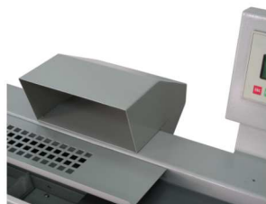
高效气味净化装置