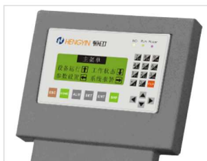
人机界面文本显示屏